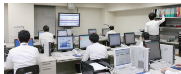
設備点検経験者常駐の監視センター

24時間体制のグループ会社内コールセンターと技術スタッフ及びエリアごとの協力会社のスピーディで適確な対応に高い評価を頂き、大手管理会社様からの設備管理業務・緊急コールの受付や緊急対応業務の受託も増加しています。